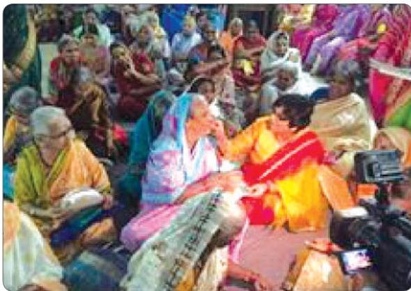
Sharing sweets, sharing happiness on the occasion of Diwali