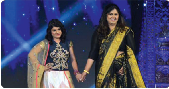
Mrs. Pankaja Munde walking the ramp with an acid attack victim