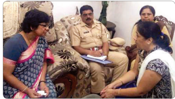
Convening police assistance if needed to resolve cases.