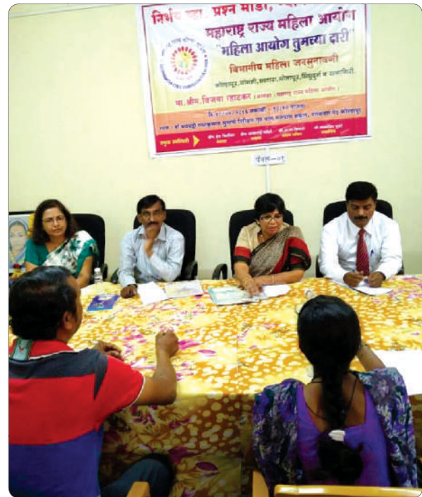
A healthy discussion with both parties ensures a soutuion to their problem.