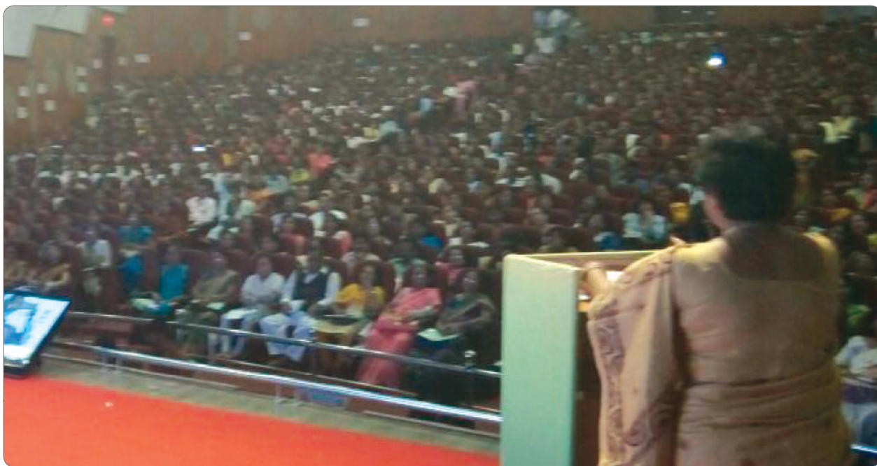
Massive public response to the commission's "Push" program