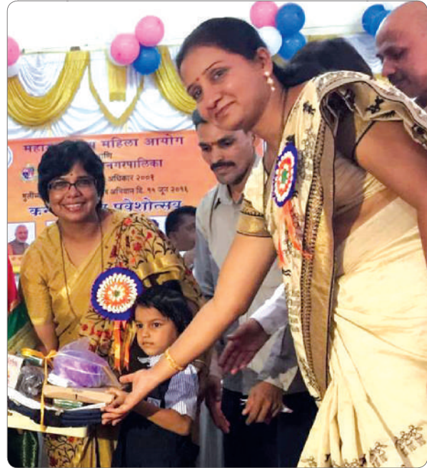
A new path - empowering the girls for a new tomorrow