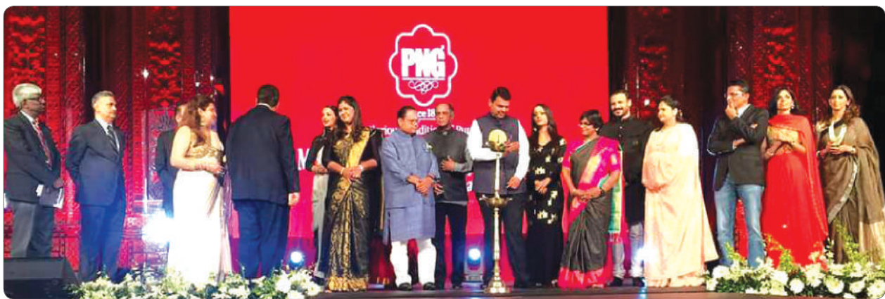
CM Shri. Devendra Fadnavis inaugurating the rampwalk organized for acid attack victims with special ornaments designed by PNG Jewellers