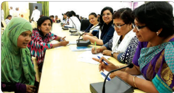
Muslim woman putting forth her problem at the commission meeting.