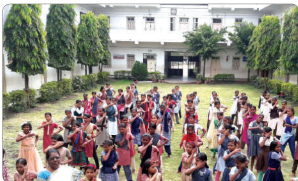
Girls at the school attending the self defence session