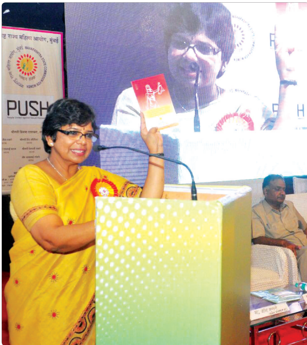
Addressing the public meeting on “Push” in Nagpur.