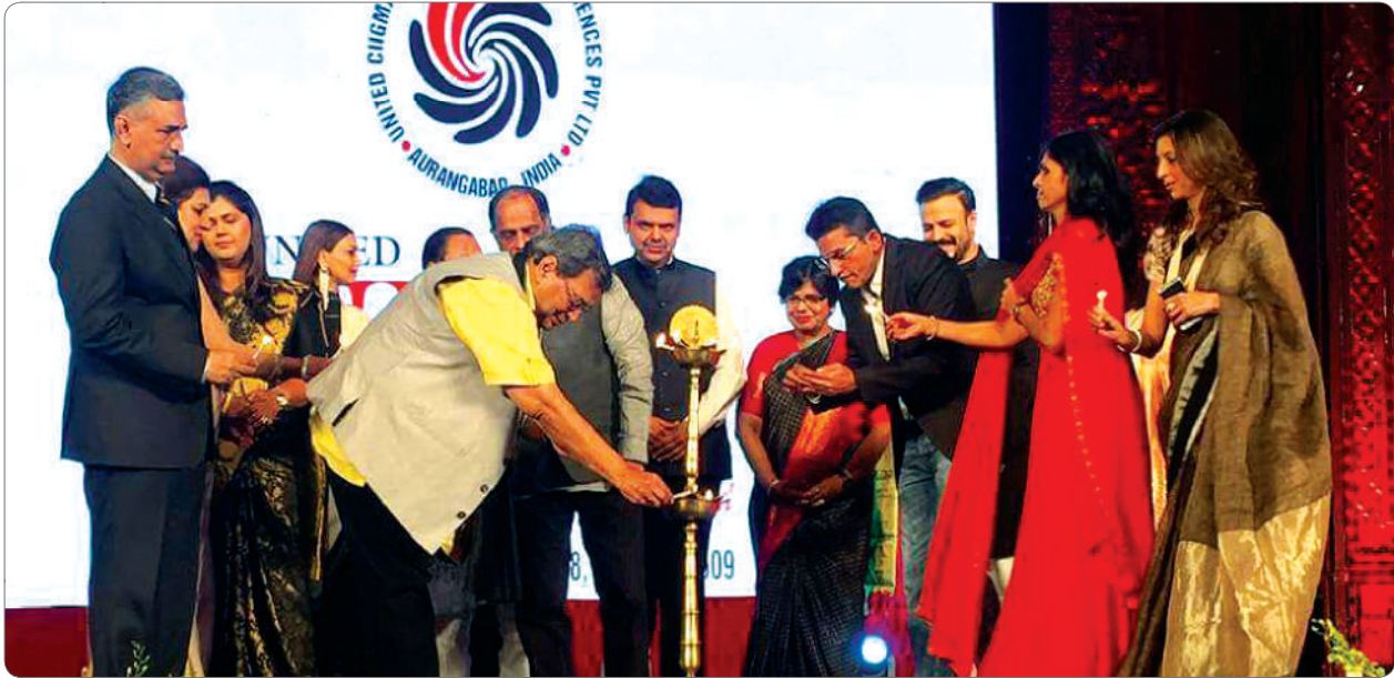
Noted Film Director Shri. Subhash Ghai lighting the lamp in the presence of CM Shri. Devendra Fadnavis and Mrs. Pankaja Munde