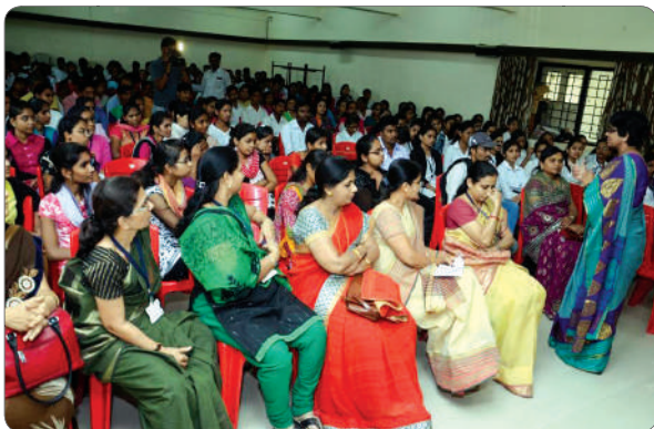
Women lecturers and girl students listening attentively.