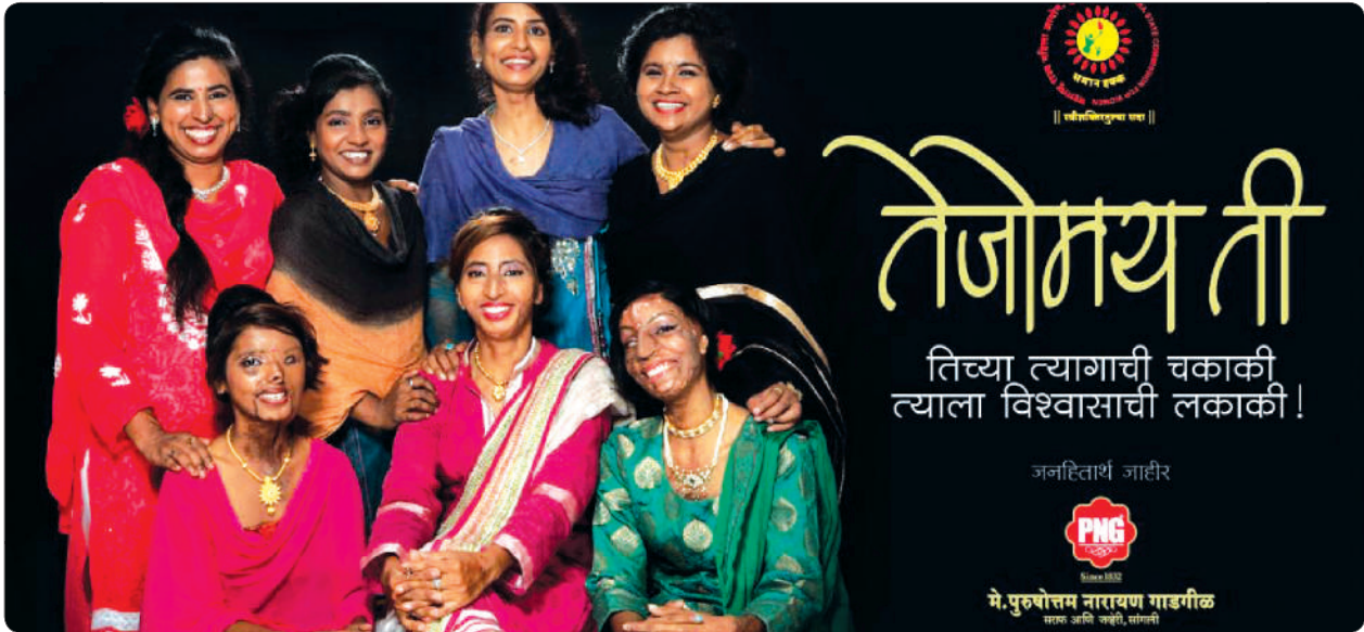
Special PNG Advertisement saluting the acid attack victims for their strength, courage and valor.