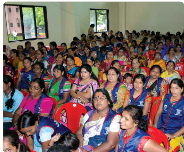
The brave volunteers of Nirbhaya Brigade.