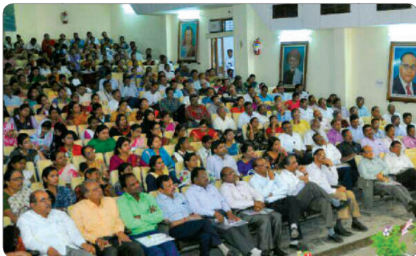
Lecturers and girl students listening attentively.