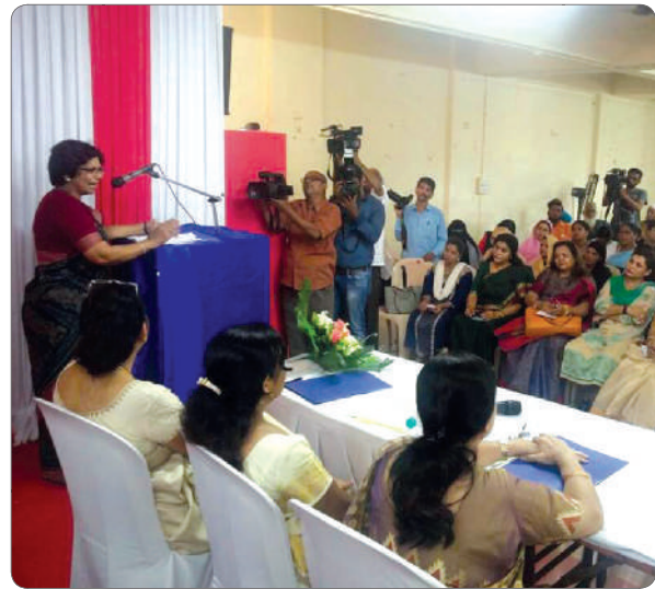
Mrs. Rahatkar discussing inclusive development of muslim women.