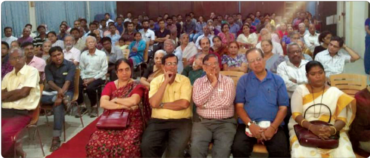
Audience at the Matrusmruti Award function