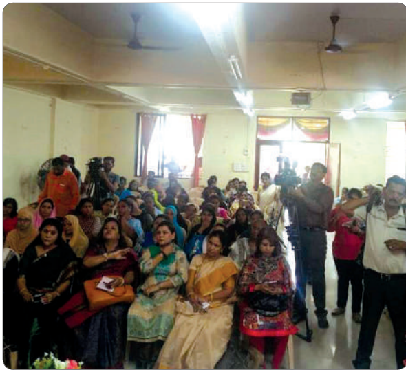
The number speaks - women at the “Triple Talaq” programme