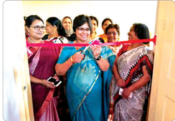
Mrs. Rahatkar cutting the ribbon to inaugurate the function.