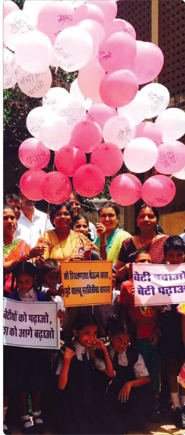
"Beti Bachao - Beti Padhao" - Smiles all the way.