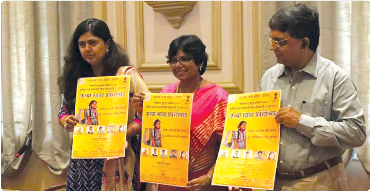
Women & Child Development Minister Mrs. Pankaja Munde inaugurating the "Kanya Shala Praveshotsav" Poster