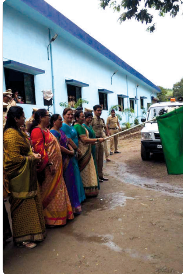
Mrs. Neelam Gorhe flagging the Nirbhaya Pathak.