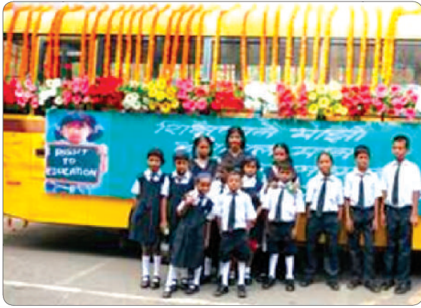
Happy students from the school on wheels at the celebration