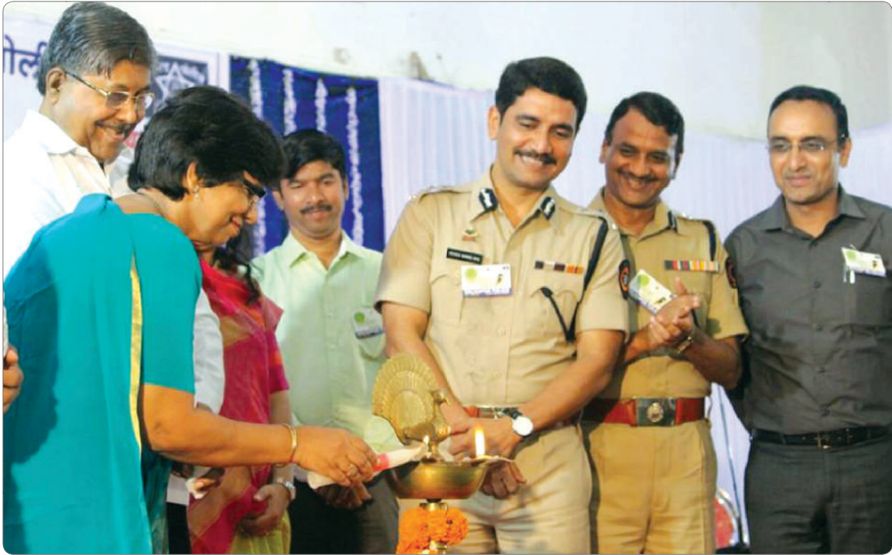
Mrs. Rahatkar with Revenue Minister Shri. Chandrakant Patil and IGP Kolhapur region, Shri. Vishwas Nangare Patil at Nirbhaya Campaign inauguration.