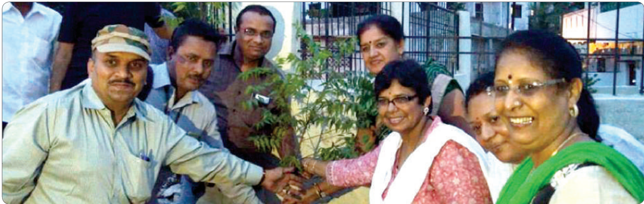
The plantation drive is an initiative of MSCW to contribute in the state government’s ambitious drive of planting 4Cr trees across the state.