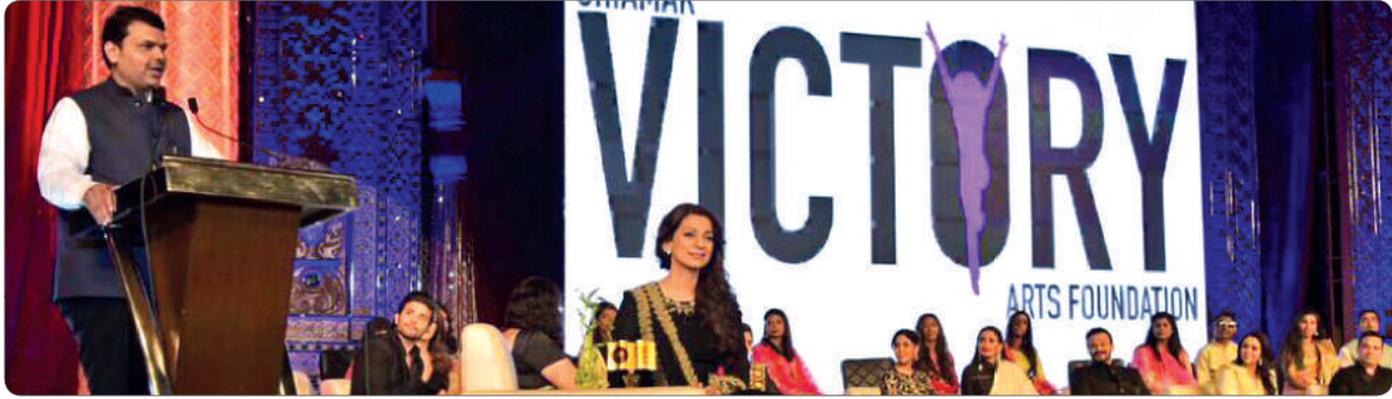
CM Shri. Devendra Fadnavis and actress Juhi Chawla at the “Sakshama” function by Victory Arts Foundation.