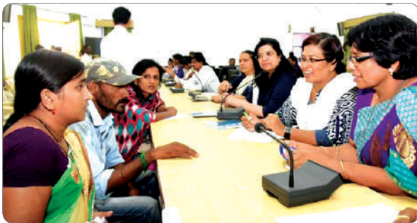
Comission hearing out both parties for a balanced way out.