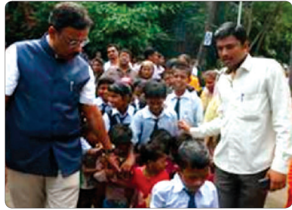
Education Minister Shri. Vinod Tawade welcoming the students