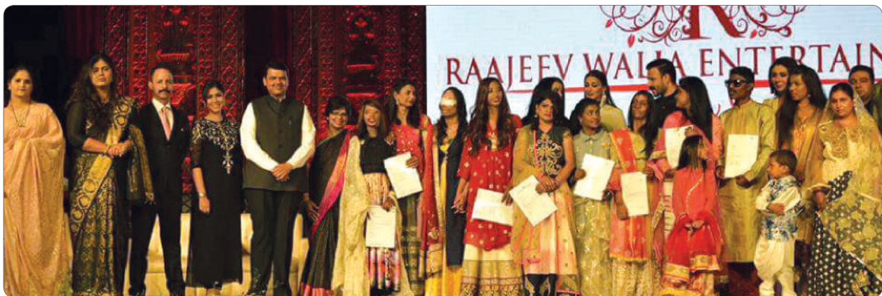
CM Shri. Devendra Fadnavis with the victorious tribe of the acid attack victims at the programme.