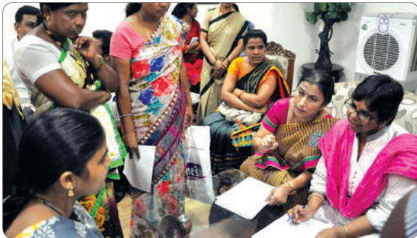
A patient listening facilitates the dialog.