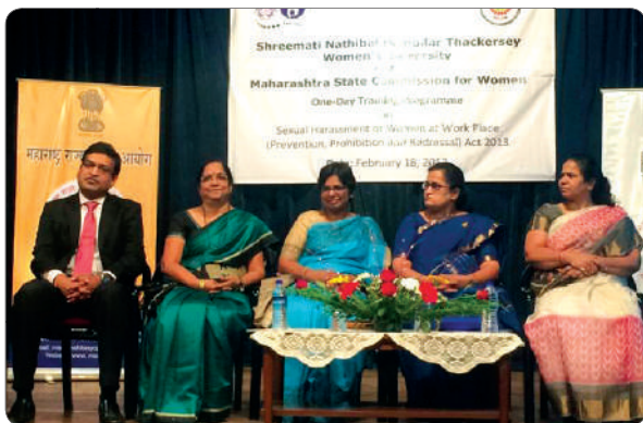
Observed massive Response of women lecturers and students in Push prog. in SNDT University.