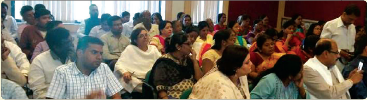
Govt employees listening at kharagpur workshop on organised by MSCW & UNFPA.

Local Complaint Redressal Committee has been established in each district under the provisions of Sexual Harassment of Women at Workplace [Prevention, Prohibition and Redressal] Act, 2013. Women working in establishments where less than ten workers are employed can appeal to the local complaint redressal committee against their abuse. The Committee is set up in each of the District Collector offices. It provides justice to the women working in unorganized sectors. The Commission has completed the training of members of these local complaint redressal committees set up in all 36 districts of the state in two stages. The training was provided in collaboration with UNFP.