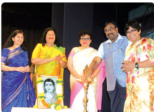
Finance Minister Shri. Sudhir Mungantiwar inaugurate the Conference.