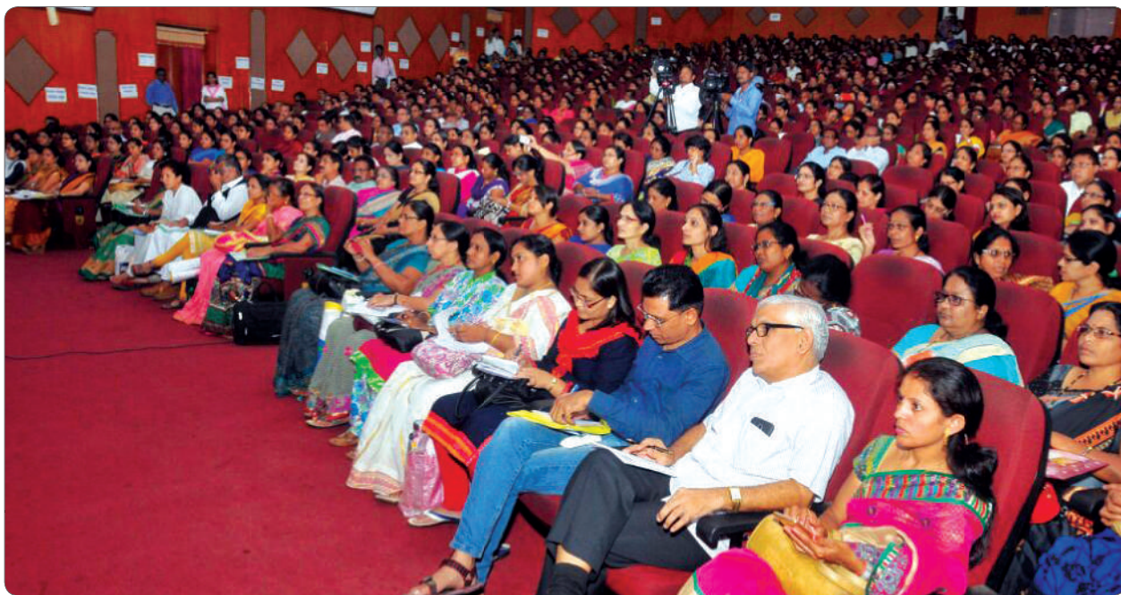
Creating awareness amongst parents and students about "Push" and relevant women laws.