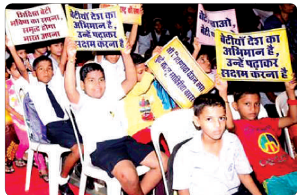
Rooting the message of "Gender Equality" from childhood