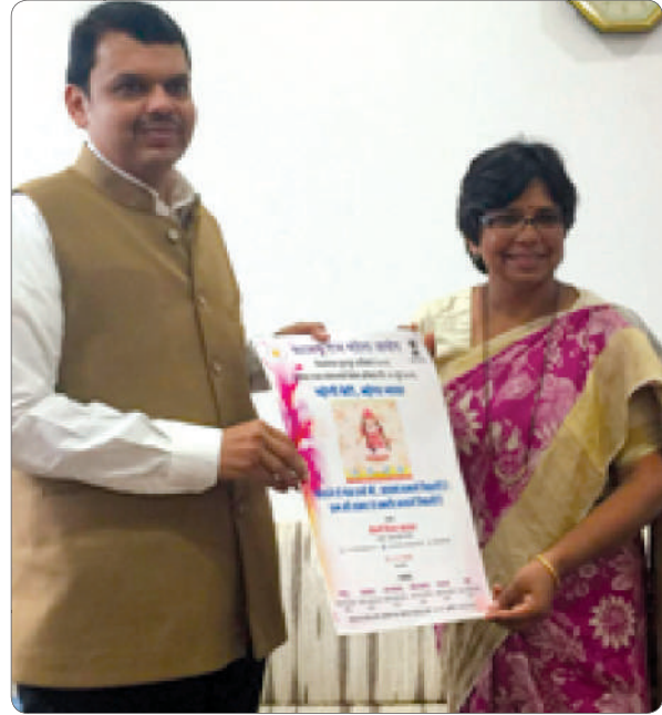
CM Shri. Devendra Fadnavis inaugurating the Project Poster.